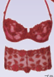
ブラ / ¥12,600 ショーツ / ¥15,750 / オーバドゥ