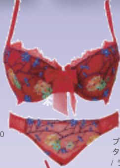
ブラ / ¥28,875 タンガ / ¥14,700 / ラヴァージ