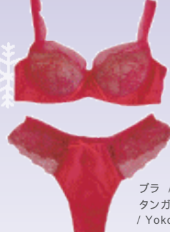
ブラ / ¥9,660 タンガ / ¥3,570 / Yoko Asami