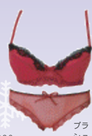
ブラ / ¥13,440 ショーツ / ¥7,350 / スワン