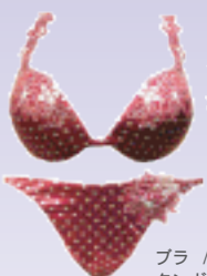
ブラ / ¥29,400 タンガ / ¥10,500 / コットンクラブ