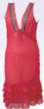
スリッパ ¥39,900 / シャンタルトーマス