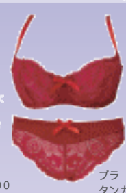
ブラ / ¥12,600 タンガ / ¥8,400 / オーバドゥ