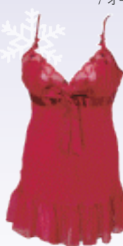
スリッパ ¥19,950 / リズシャルメル