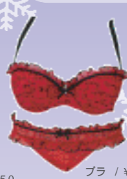
ブラ / ¥15,750 タンガ / ¥10,500 / シャンタルトーマス