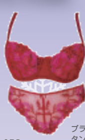
ブラ / ¥13,650 タンガ / ¥11,025 / オーバドゥ