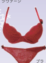
ブラ / ¥18,900 タンガ / ¥8,400 / オーバドゥ