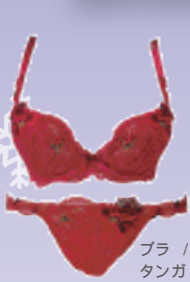
ブラ / ¥24,150 タンガ / ¥12,600 / リズシャルメル

今年もマイコレクションでは、たくさんの『赤いブラ』を取りそろえました！ "クリスマスの赤" "年越しの赤" この冬はどの"赤"で過ごしますか？